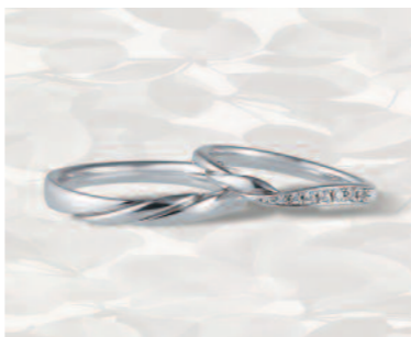
▲【コラニー】「ハーモニー」くるりと巻いた花びらの反り返しを表現しており、温かみのある柔らかさが特徴的