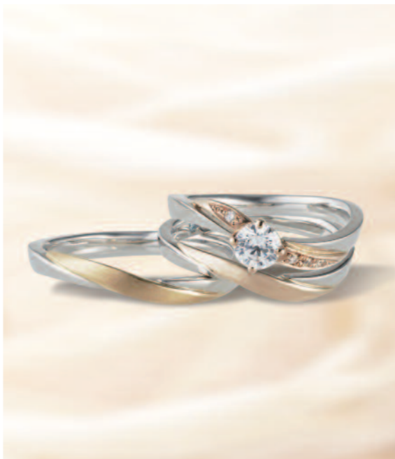
▲【ラバージュ】優美な曲線と繊細さをあわせ持つ。三重での取扱いは同店のみ