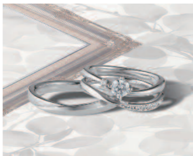
▲【コラニー】「ピュア」ふたりの純粋な気持ちを表す純白のバラをモチーフとした、アシンメトリーなデザイン