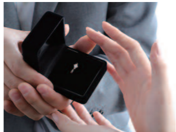
▲サプライズプロポーズをサポートしてくれる

結婚品コーナーもあり、指輪選びはもちろん結納など、結婚に関することなら何でも相談にのってもらえる。またアフターサービスも充実しており、リングクリーニングは何度でも無料。サイズ直し・キズ修理等にも、迅速に対応してくれる。「ここなら購入した後も安心できる」と訪れるカップルも多い。事前予約で定休日や時間外でも対応してくれるので、忙しいふたりにもうれしいショップ