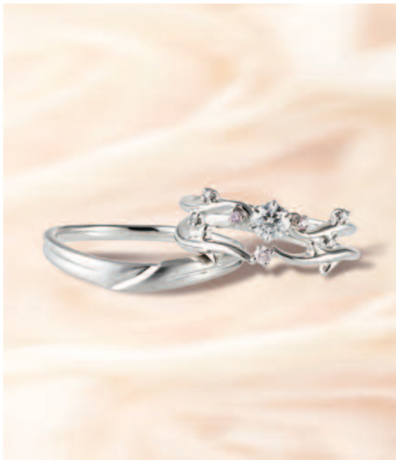
▲【ひな】メレダイヤにもこだわった和カワイイリング。三重での取扱いは同店のみ