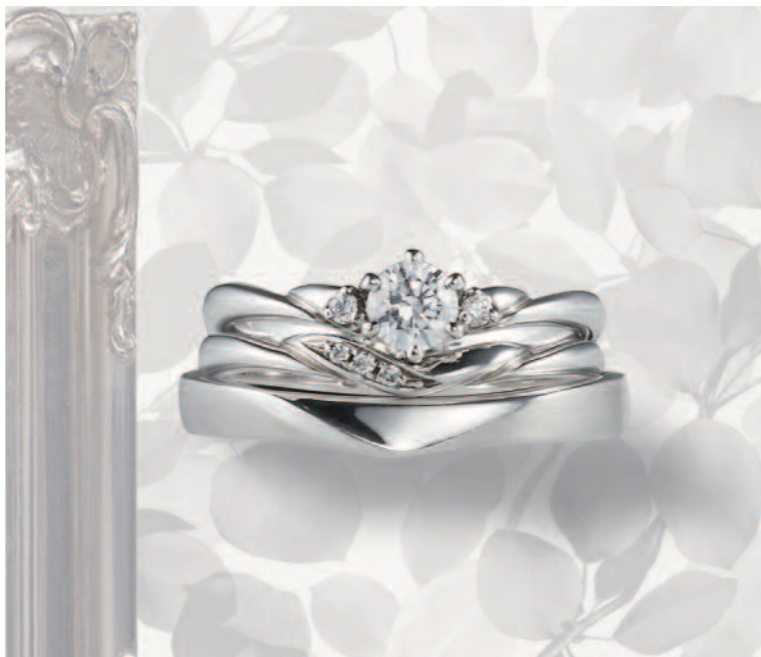
▲【コラニー】技能五輪全国大会優勝の職人が作りこだわった、生涯愛せる指輪。三重での取扱いは同店のみ