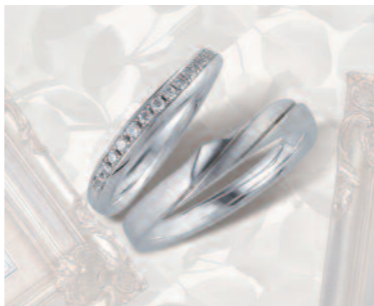
▲【コラニー】「くるみ」彼のリングは彼女を守る堅いくみの実。その中で彼女は美しくエレガントに輝く