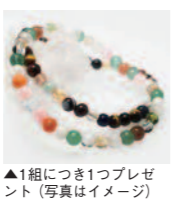
▲1組につき1つプレゼント(写真はイメージ)

1軒目に来店したカップルには、もちろん天然石の「パワーストーンプレスレット」をプレゼント(予約不要)。またリング成約で、新生活にピッタリの食器セットをプレゼント