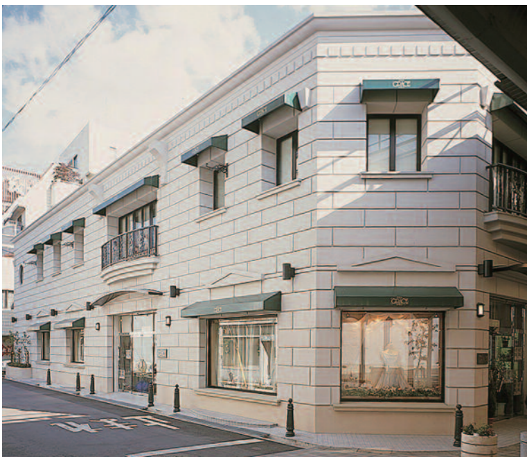
▲バリのヴァンドーム広場をイメージした津の隠れ家的店舗。事前の電話予約で営業時間外や定休日でも対応可