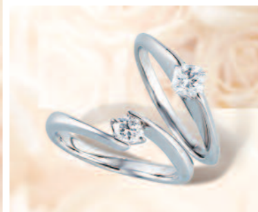
▲【フランダース・ダイヤモンド】独特の輝きを放つ八角形のダイヤモンドが魅力。三重での取扱いは同店のみ