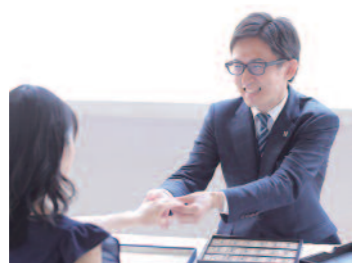
▲米国宝石学会鑑定士がプロの視点でアドバイス

1896年の創業以来、老舗ならではの独自ルートで生涯を共にするのにふさわしい上質リングを厳選し、取扱っているグレイスキタムラ。経験豊富なスタッフが親身な接客で、はじめての指輪選びをサポートしてくれる。アットホームな雰囲気なので、男性ひとりの来店も多いそう。店内には鑑定士の資格を持つスタッフが常駐しており、サプライズポーズもサポートしてくれる。店舗2階には