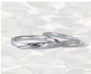
▲【コラニー】「ハーモニー」くるりと巻いた花びらの反り返しを表現しており、温かみのある柔らかさが特徴的