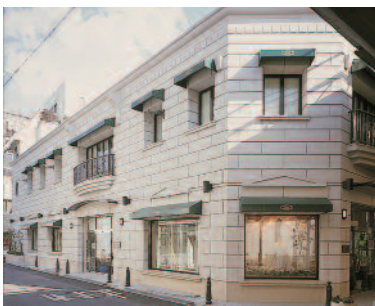
▲バリのヴァンドーム広場をイメージした津の隠れ家的店舗。事前の電話予約で営業時間外や定休日でも対応可