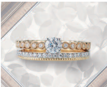
▲【ロゼット】英国調の気品漂う、優雅でオシャレなクラシカルデザインが人気。三重での取扱いは同店のみ