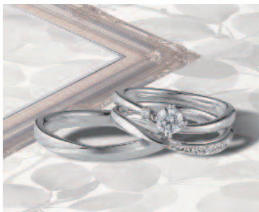
▲【コラニー】「ピュア」ふたりの純粋な気持ちを表す純白のバラをモチーフとした、アシンメトリーなデザイン