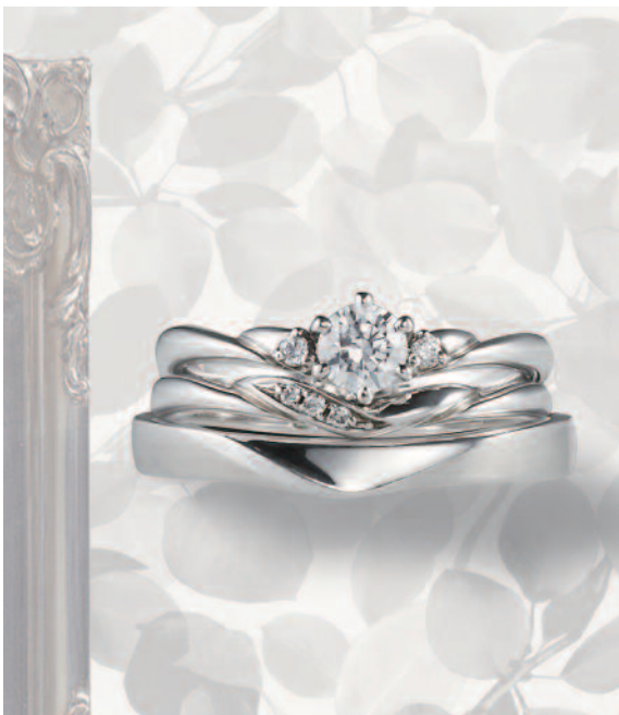
▲【コラニー】技能五輪全国大会優勝の職人が手掛ける。三重での取扱いは同店のみ