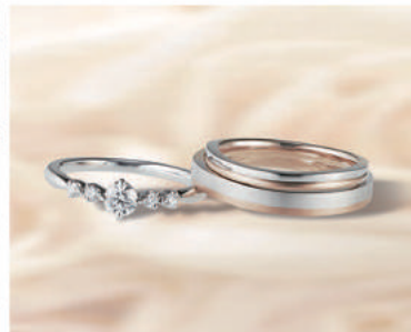
▲【ひな】風に舞う薄紅色の八重桜の花びらをモチーフにした「八重桜」。ふたりに幸せが積み重なりますように