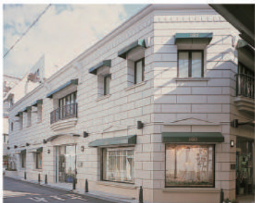
▲パリのヴァンドーム広場をイメージした津の隠れ家的店舗。事前の電話予約で営業時間外や定休日でも対応可