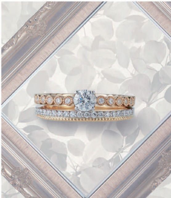
▲【ロゼット】英国調の気品漂う優雅なデザインが人気。三重での取扱いは同店のみ