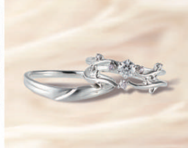
▲【ひな】メレダイヤにもエクセレントカットを使用した和カワイイ繊細リング。三重での取扱いは同店のみ