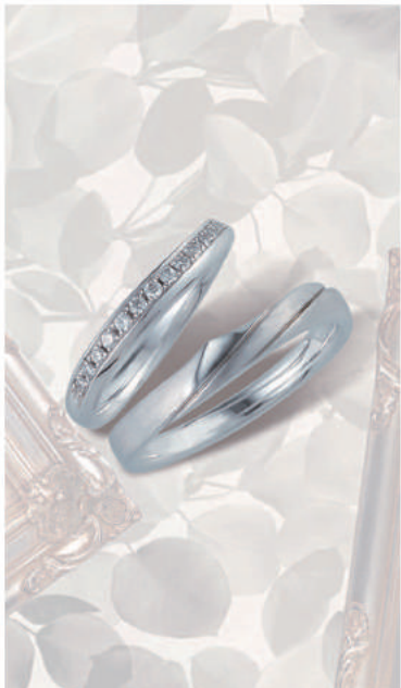
▲【コラーニー】「くるみ」彼のリングは彼女を守る堅いくるみの実。その中で彼女は美しくエレガントに輝く