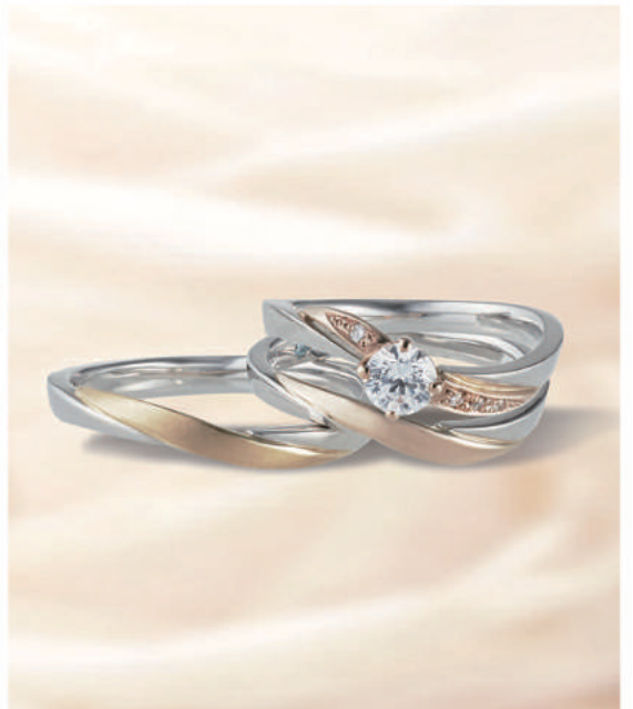
▲【ラバージュ】優美な曲線と繊細さをあわせ持つ。三重での取扱いは同店のみ