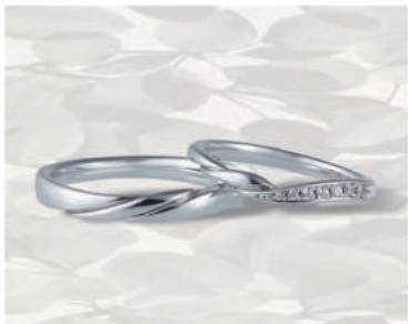
▲【コラーニー】「ハーモニー」くると巻いた花びらの反り返しを表現しており、温かみのある柔らかさが特徴的