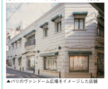
▲パリのヴァンドーム広場をイメージした店舗

1軒目来店特典 1軒目の来店でパワーストーンブレスレットをプレゼント! 1軒目に来店したふたりには、天然石パワーストーンブレスレットをプレゼント!「願いが叶うとクラックが消える」と言われているクラック水晶を使った可愛いブレスレット ▲来店予約は不要。1組にひとつプレゼント