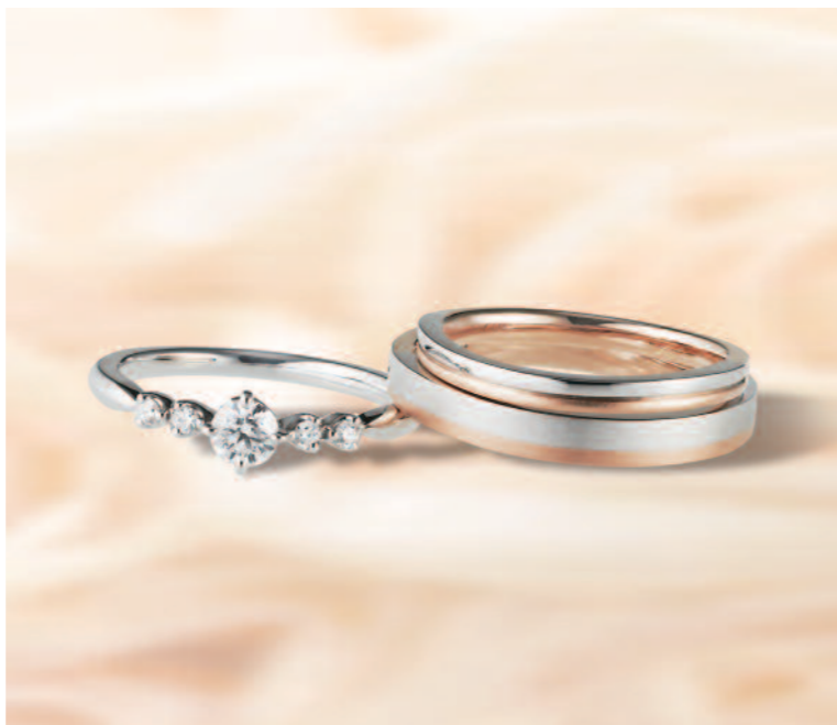
▲【ひな】メレダイヤにもエクセレントカットを使用した和カワイイ繊細リング。三重での取扱いは同店のみ