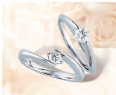
▲【フランダース・ダイヤモンド】独特の輝きを放つ八角形のダイヤモンドが魅力。三重での取扱いは同店のみ