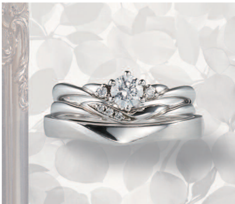
▲【コラニー】熟練の技を持つ職人が作りと着け心地にこだわった生涯愛せるリング。三重での取扱いは同店のみ

先輩カップルの声 「長く愛せる、シンプルで美しい指輪が見つかりました」 「気になるブランドを取扱っていると知り、来店しました。長く着ける指輪なので、シンプルで飽きないデザイン、でも着けていてワクワクする指輪を探していましたが、まさに理想の指輪が見つかりました。疑問にも丁寧に答えて下さり、購入後のサポートも充実していたので、安心して購入できました」