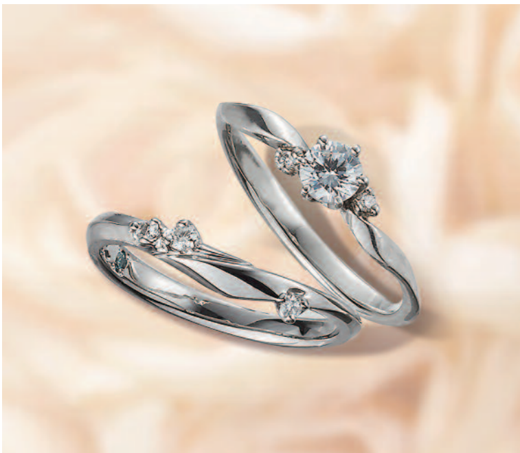
▲【ラバージュ】優美な曲線と繊細さをあわせ持つ、長く愛せる上質なフォルム。三重での取扱いは同店のみ