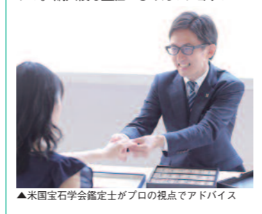
▲米国宝石学会鑑定士がプロの視点でアドバイス