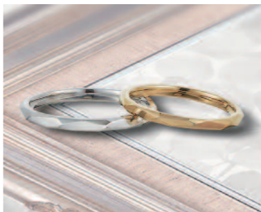
▲【ロゼット】ふたりの固い絆を表現した「小枝」。カットされた面がキラキラと輝き、指を美しく見せてくれる