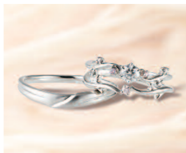
▲【ひな】"香りたつ「花蕾」、結びつき天に伸びゆく「花かずら」。ピンクダイヤへの変更などアレンジも可能