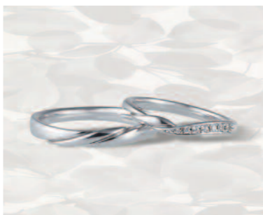
▲【コラニー】「ハーモニー」くるりと巻いた花びらの反り返しを表現しており、温かみのある柔らかさが特徴的