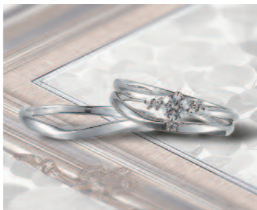
▲【いい夫婦ブライダル】婚約&結婚指輪の3本を好きな組み合わせで選べる。三重での取扱いは同店のみ