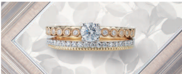
▲【ロゼット】「しずく」"光の粒を集めたようなふたりの大切な想い出"をイメージしたクラシカルなデザイン