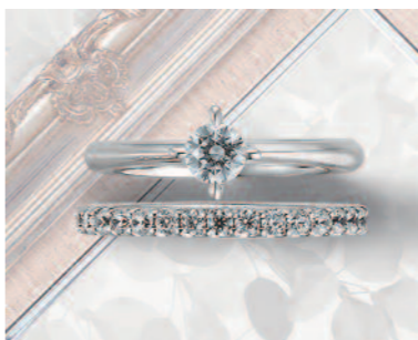
▲【コラニー】「オーバースワン」"ふたりの未来の輝き"がテーマ。ダイヤの輝きを最大限に引き立てるデザイン