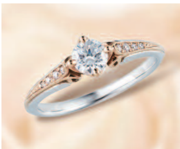
▲【ラバージュ】ヨーロッパアンティークの気品漂う、立体的でエレガントなデザインが人気の「ボン・ヌフ」