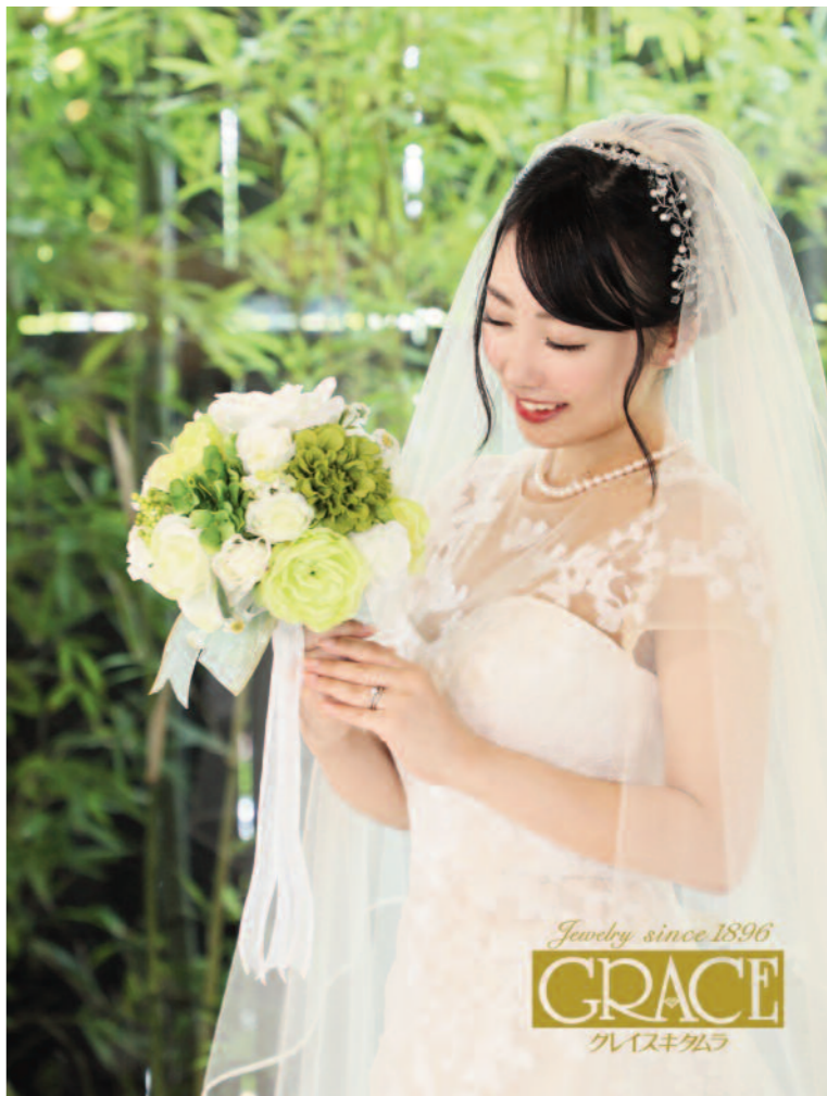
▲婚約指輪・結婚指輪はもちろん結納品も扱う津の老舗。一生の絆としてふさわしい上質リングのみを厳選

北・南勢エリアからも来店 生涯つきあえる信頼の老舗 創業124年を誇る老舗で親子二代・三代での顧客も多い。親から譲り受けたダイヤのリフォームにも対応しており、セミ・フルオーダーも可能。アフターサービスも充実し、地元はもちろん北・南勢エリアからも評判を聞きつけ続々来店している。指輪選びが不安なふたりは、まずは訪ねてみて。