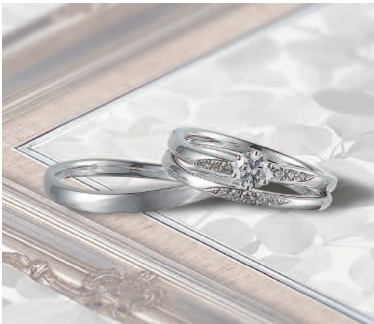
▲【ロゼット】イングリッシュガーデンをテーマにした気品漂うデザインが人気。三重での取扱いは同店のみ