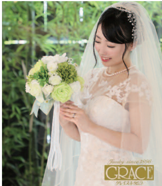
▲結婚品も扱う津の老舗。一生の絆としてふさわしい上質リングのみを厳選