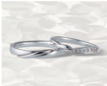
▲【コラニー】「ハーモニー」くるりと巻いた花びらの反り返しを表現しており、温かみのある柔らかさが特徴的