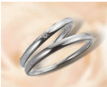
▲【ひな】「十二単」色を重ね合わせていくように、指輪を重ね合わせて楽しめる。細身に華奢なラインが魅力