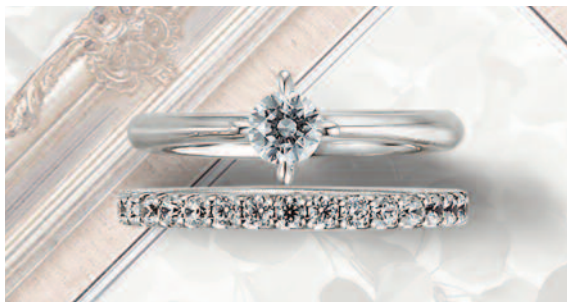
▲【コラニー】熟練の職人が究極の着け心地を追求。三重での取扱いは同店のみ