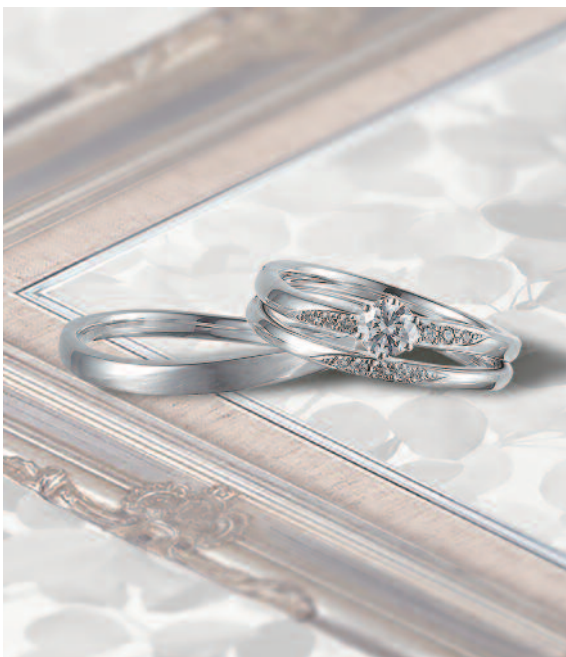
▲【ロゼット】 英国調の気品漂う優雅なデザインが人気。三重での取扱いは同店のみ