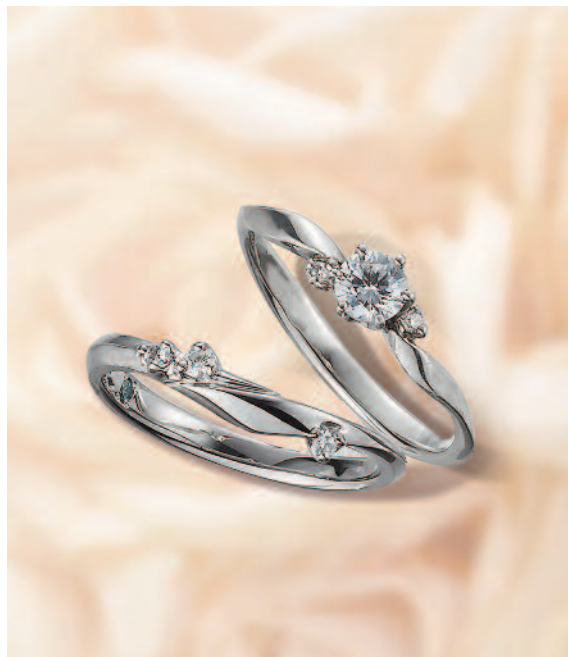
▲【ラバージュ】 優美な曲線と繊細さをあわせ持つ。三重での取扱いは同店のみ