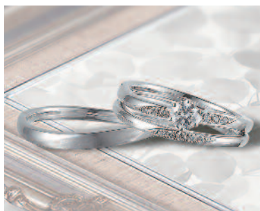
▲【ロゼット】イングリッシュガーデンをモチーフにした気品漂うデザインが人気。三重での取扱いは同店のみのみ