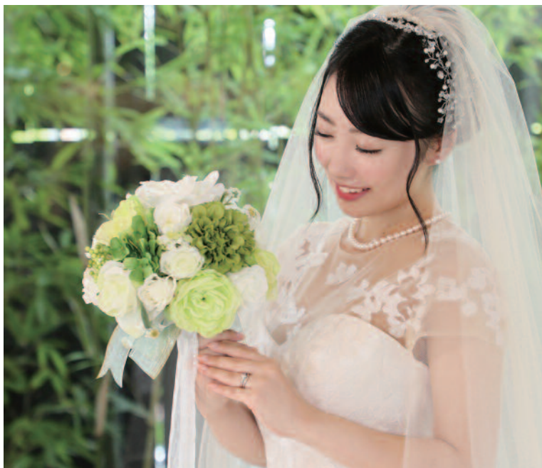
▲婚約指輪・結婚指輪はもちろん結納品も扱う津の老舗。一生の絆としてふさわしい上質リングのみを厳選