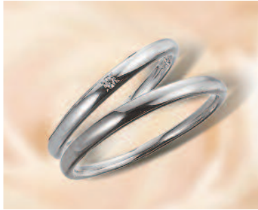
▲【ひな】「十二単」色を重ね合わせていくように、指輪を重ね合わせて楽しめる。細身で華奢なラインが魅力