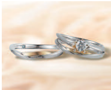
▲【ラバージュ】「ヴァニユ」は甘いバラの花がモチーフ。ゴールドが指をより美しく引き立ててくれる