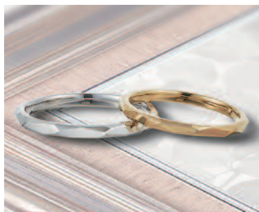
▲【ロゼット】ふたりの固い絆を表現した「小枝」。カットされた面がキラキラと輝き、指を美しく見せてくれる