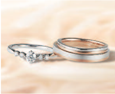
▲【ひな】風に舞う薄紅色の八重桜の花びらをモチーフにした「八重桜」。ふたりに幸せが積み重なりますように