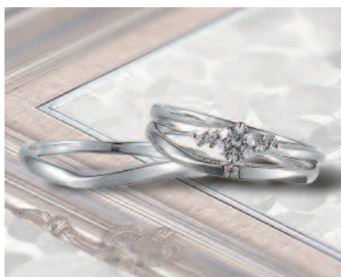
▲【いい夫婦ブライダル】婚約&結婚指輪の3本を好きな組み合わせで選べる。三重での取扱いは同店のみのみ