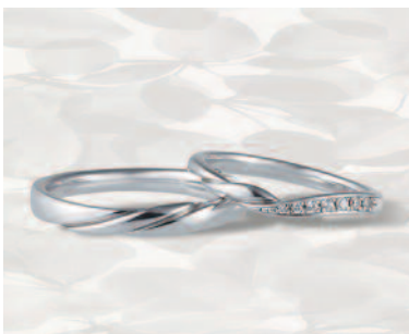
▲【コラーニー】「ハーモニー」くるりと巻いた花びらの反り返しを表現しており、温かみのある柔らかさが特徴的