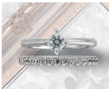
▲【コラーニー】サイズ直しと新品仕上げが50年間無料と生涯愛せる手作りリング。三重での取扱いは同店のみのみ