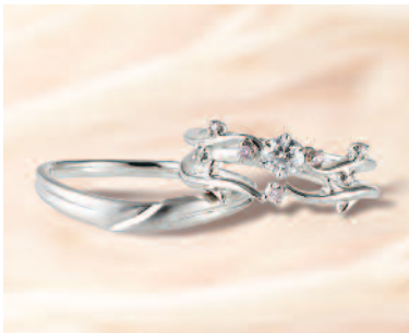
▲【ひな】メレダイヤにもエクセレントカットを使用したカワイイ繊細リング。三重での取扱いは同店のみのみ