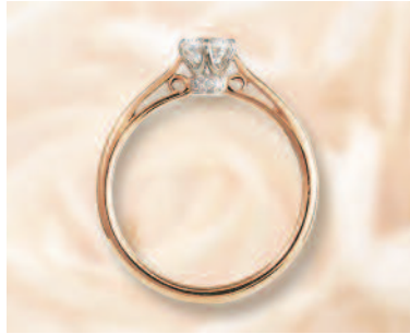
▲【ラバージュ】「ボン・マリー」人気のクラシックシリーズ。横から見た時の可愛らしいデザインに注目して