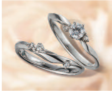
▲【ラバージュ】優美な曲線と繊細さをあわせ持つ、長く愛せる上質なフォルム。三重での取扱いは同店のみのみ