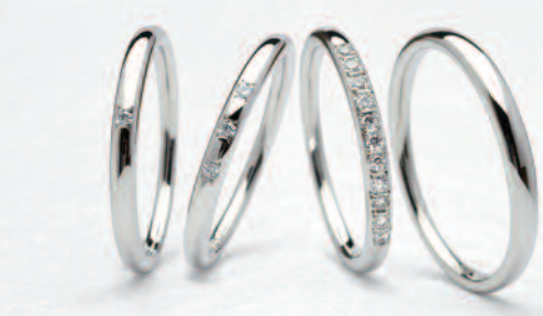
▲【ひな】メレダイヤにもエクセレントカットを使用。三重での取扱いは同店のみ