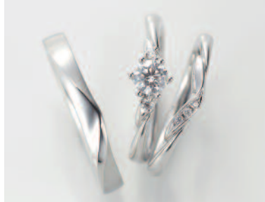
▲【コラニー】「スウィートキャンディ」花びらを重ね合わせて、ハートをイメージ。可憐な花嫁にぴったり