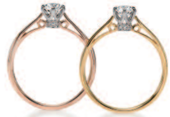
▲【ラバージュ】「ボン・マリ」人気のクラシックシリーズ。横から見た時の可愛いデザインに注目して