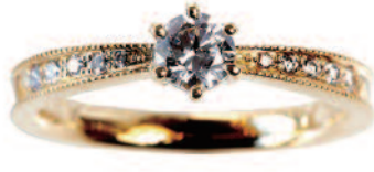
▲【ロゼット】イングリッシュガーデンをモチーフにした気品漂うデザインが人気。三重での取扱いは同店のみ