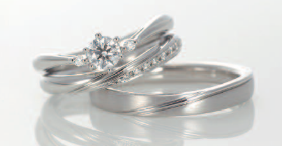
▲【コラニー】サイズ直しが50年無料の手作りリング。三重での取扱いは同店のみ