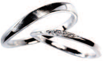
▲【ロゼット】「月あかり」静かに強く永遠に変わらない愛をテーマにした、しなやかな曲線が美しいデザイン