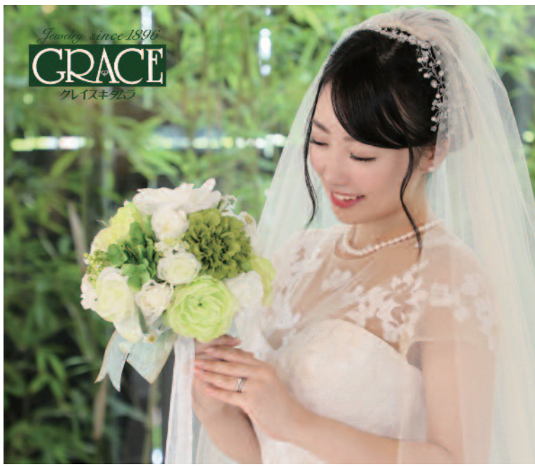
▲婚約指輪・結婚指輪はもちろん結納品も扱う津の老舗。一生の絆としてふさわしい上質リングのみを厳選